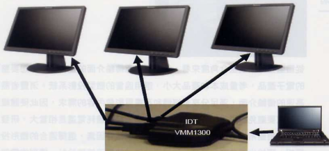
《圖三 DisplayPort的中樞連接模式》

是筆記型電腦或桌上型電腦)共同運作。另一個DisplayPort多重螢幕解決方案的重要優勢則是，既然此解決方案純粹是由硬體實現，所以便不需要Microsoft WHQL認證。