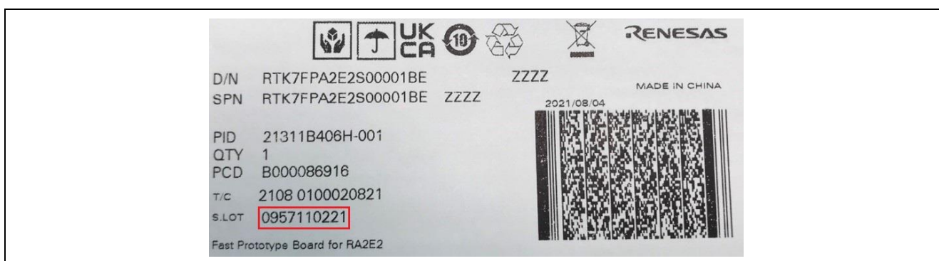
図 3. FPB-RA2E2 キット梱包箱のシリアル番号の識別

シリアル番号は、S.LOT と書かれた梱包箱ラベルと、FPB-RA2E2 ボードの背面/底面に貼られたシリアル番号ステッカーに記載されています。図 3 および図 4 の例では、シリアル番号は「0957110221」です。