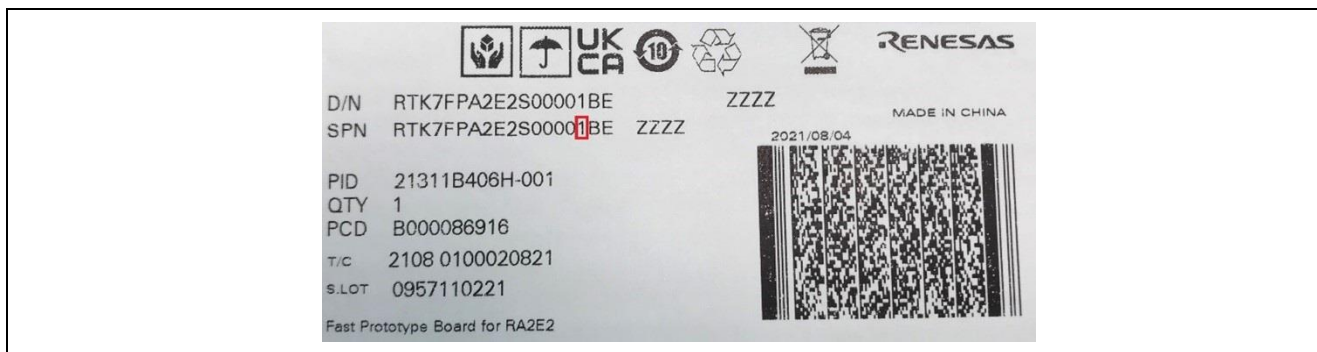
図 2. FPB-RA2E2 キット梱包箱のバージョン番号の識別

キットのバージョンは、この項で説明する FPB-RA2E2 キットの梱包箱のラベルに記載されています。キットのバージョンは、図 2 に示すように、発注型名の最後の数字です。以下の例では、キットのバージョン番号は「1」です。