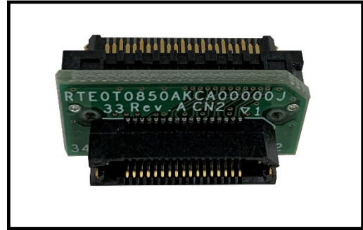
Figure 1 External View of the RTE0T0850AKCA00000J

The RTE0T0850AKCA00000J adapter is used for conversion from the 34-pin connector for external tracing to the 46-pin connector for external tracing.