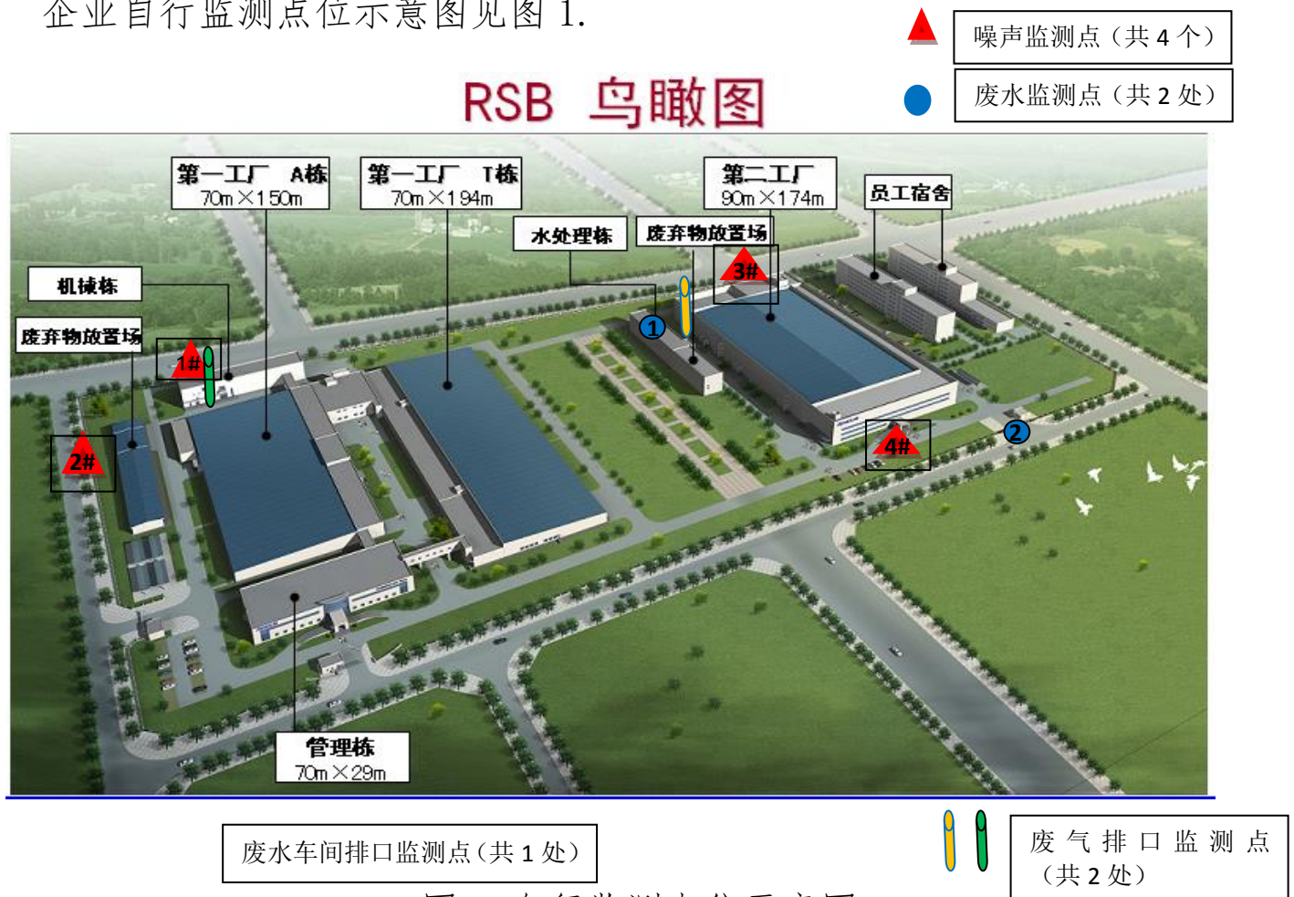
图 1 自行监测点位示意图