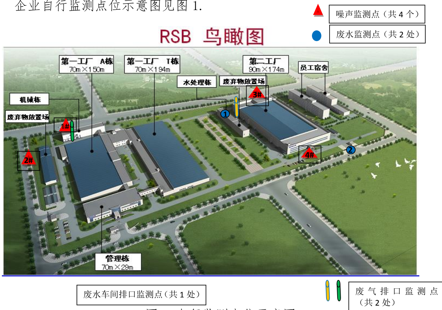
图 1 自行监测点位示意图