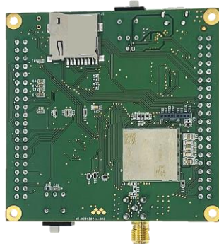
monoZero Add-on Board