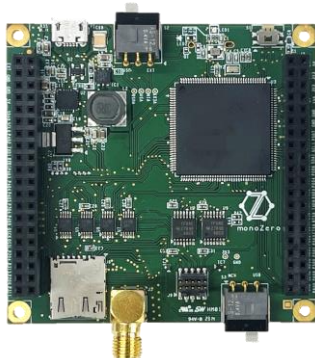
monoZero with RA6M5