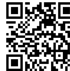
MyRenesasの 二次元バーコード