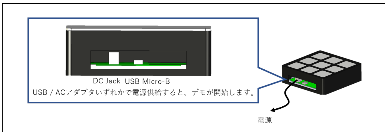
図 2-1 機器接続図