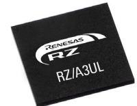
361-pin, 13x13mm PBGA (0.5mm pitch)

RZ/A3ULは、最大動作周波数1GHzで、高速DDR3L/DDR4 RAMインターフェース(オプション)もサポート、優れたパフォーマンスを提供します。RZ/A3ULは、高性能なデバイスでありながら、エントリクラスのRZ/Aシリーズの新製品として、HMI向けシステム、IoTゲートウェイ、オーディオ・デバイスなどに適した、コストエフェクティブなソリューションを提供します。