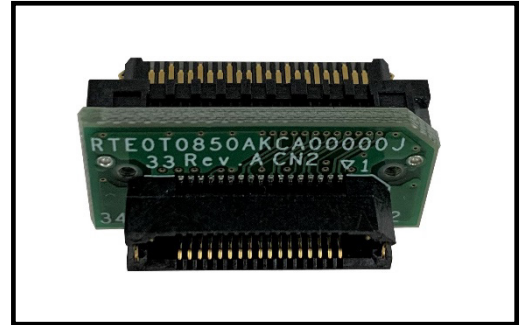
図 1 RTE0T0850AKCA00000J の外観

RTE0T0850AKCA00000J は、34 ピン外部トレースコネクタを 46 ピン外部トレースコネクタに変換するアダプタです。