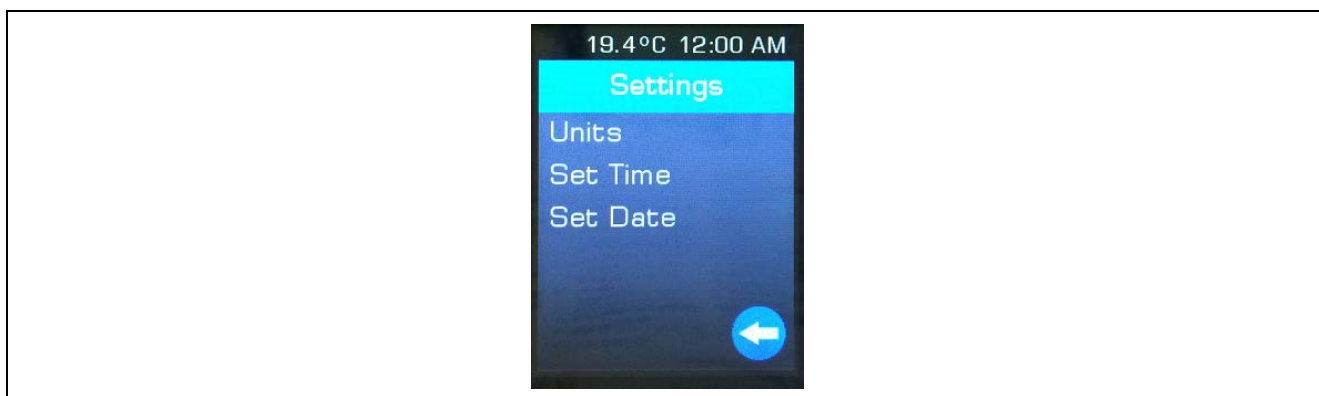
図 4 PK-S5D9 のシステム設定（Units、Set Time、Set Date）画面

設定アイコンをタップすると、[Units]、[Set Time]、[Set Date] のシステム設定ができます（図 4 を参照）。