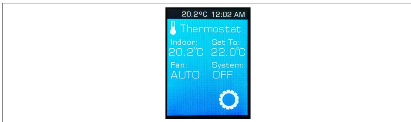
図 3 PK-S5D9 サーモスタットデモ

起動画面をタップするとサーモスタットのデモが始まります。MCU に搭載された温度センサーの情報を、A/D コンバータを使用して読み取り、その読み取られた情報が LCD 画面に表示されます (図 3 を参照)。