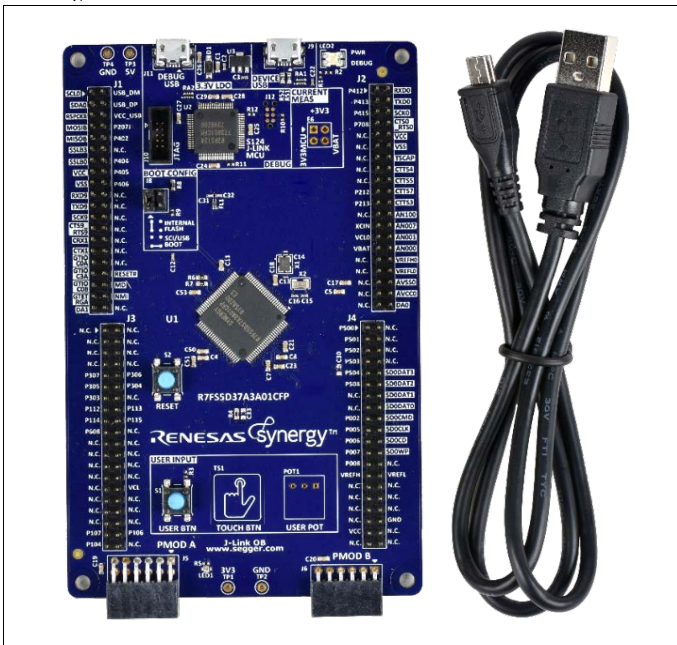
図 1 TB-S5D3 ボード