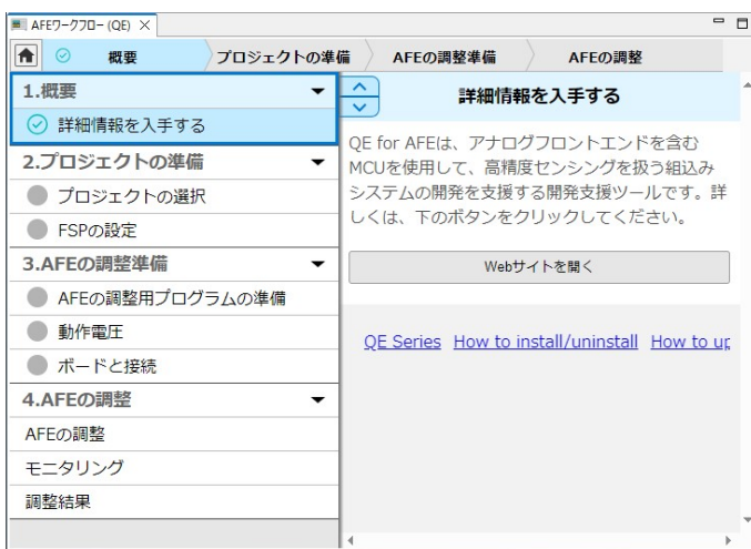
図 1. ガイドが充実したタイプ

ガイダンス、チュートリアル動画などを載せている「ガイドが充実したタイプ」と、ビューの幅が狭く、「ガイドがシンプルなタイプ」です。2つのタイプは、ビュー表示幅を変えることにより、自動的に切り替わります。