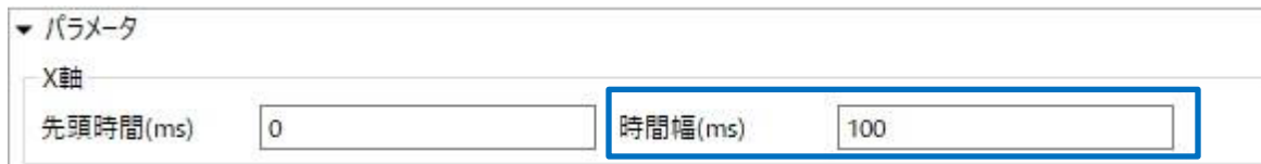
図 3. X 軸の時間幅の設定

[モニター]タブの X 軸時間幅を大きく設定しても、メモリのオーバーフローにならないように改善しました。