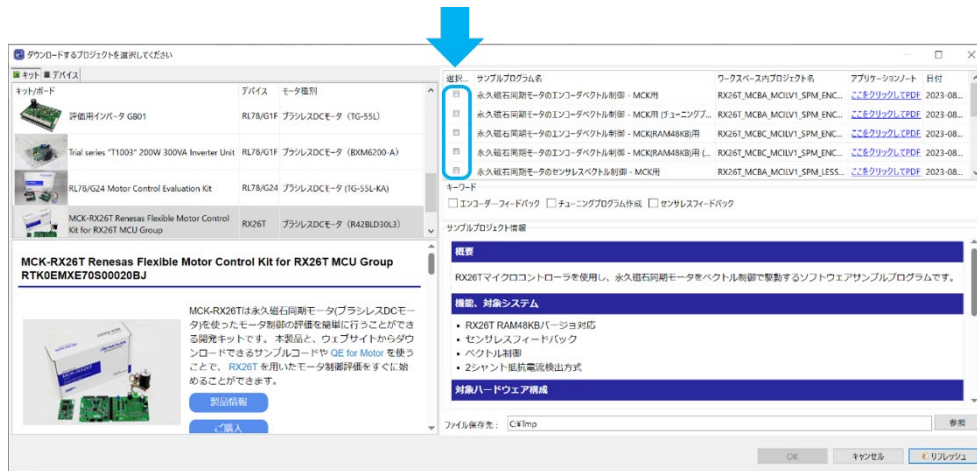
図 2 サンプルプログラムダウンロードウィザード画面のチェックボックス

サンプルプログラムダウンロードウィザードでチェックボックスをチェックすることにより、複数のプロジェクトを e 2 studio に一括インポートできるようになりました。 サンプルプログラムダウンロードウィザードは、[プロジェクトの準備]ページの[モータ用サンプルプログラムのダウンロードとインポート]ボタンから利用できます。