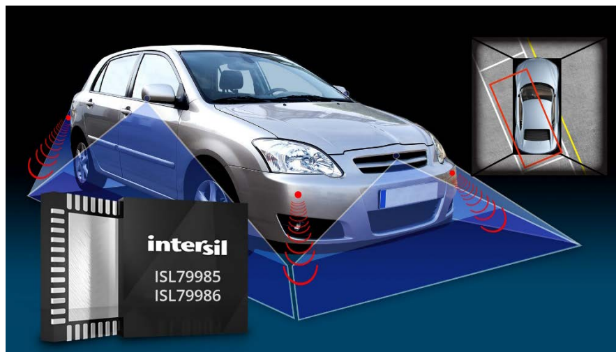
図 3 : ISL7998x 4 チャンネル・ビデオ・デコーダは超鮮明な画像を提供し、ドライバーと歩行者の安全性を向上

サラウンドビュー・モニタとも呼ばれるアラウンドビュー・モニタ・システムは、4 個のカメラから伝送されるビデオ画像を処理し、4 つの画像を単一の鳥瞰映像に合成し、クルマの上方に設置したカメラで撮影したかのような画像を提供する。モニタにより、ドライバーは周囲の対象物に対するクルマの相対的な位置を視覚的に把握でき、クルマの操作や駐車が容易になる。Infinity Research によれば、アラウンドビュー・モニタ・アプリケーションだけの 2018 年までの年平均成長率は 33 パーセントとなる。