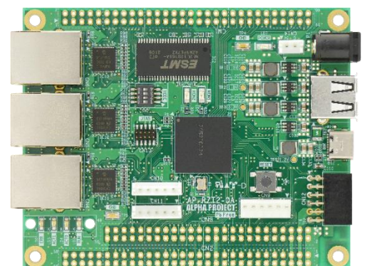
基板サイズ : 100 x 80 mm (コネクタ、突起物除く)