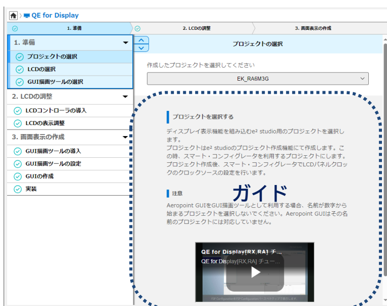
図 1. 充実したガイドを表示

初回のメインビュー起動時は、図1 のガイダンス、チュートリアル動画などを載せているガイドが充実したタイプのビューを表示します。ビューの幅を狭くすると、図2 のシンプルなガイドタイプのビューを表示します。2 つのタイプのメインビューは、ビューの表示幅を変えることにより、自動的に切り替わります。